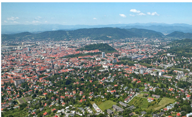
Steirischer Zentralraum.

Die Herausforderung besteht vor allem darin, die Anforderungen und Bedürfnisse der Bewohner/-innen einer Großstadt mit jenen von stadtnahen und ländlichen Gemeinden zu verbinden und adäquate Lösungsansätze für eine zukunftsfähige gesamtregionale Entwicklung zu schaffen. Im Zuge des Projektes sollen mögliche Interaktionen zwischen städtischen, stadtnahen und ländlichen Räumen sichtbar gemacht sowie Kooperationen aufgebaut und weiterentwickelt werden.