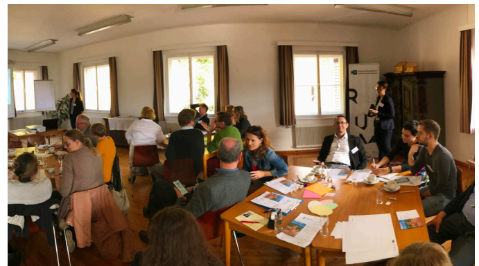
„Multi-Stakeholder Workshop in Stübing“

Die Einbeziehung von regionalen Akteur/-innen in das transnationale Projekt ROBUST ist dem österreichischen Forschungsteam besonders wichtig. Im Projektjahr 2019 wurden deshalb Interviews mit mehr als zwei Drittel aller Bürgermeister/-innen der 52 Gemeinden des Steirischen Zentralraums geführt und ein Diskussionsforum mit regionalen Stakeholdern durchgeführt.